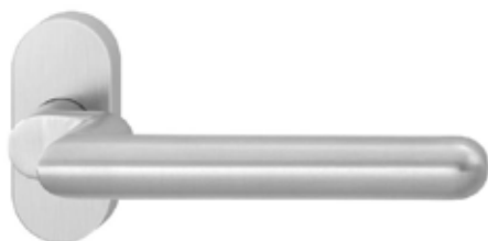
HAFI Public Line – Design 326/788

Türdrücker auf ovaler Rosette, mit Federvorspannung, nicht rechts/links verwendbar, unsichtbare Befestigung