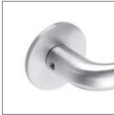
Reduzierte Randhöhe 4 mm