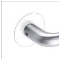
RAL-Farbtone nach Wunsch