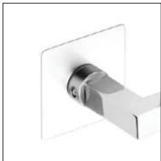
RAL-Farbtone nach Wunsch