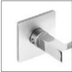
Reduzierte Randhöhe 4 mm