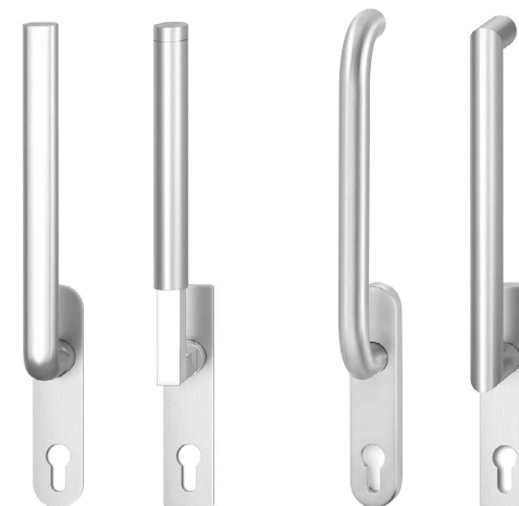
HAFI Flush Line