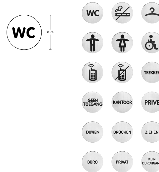
HAFI Wohnaccessoire – Design 998

Hinweisschilder, mit Text bzw. Symbol, Klebepunkt auf der Rückseite