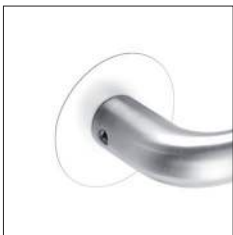
RAL-Farbtönen nach Wunsch