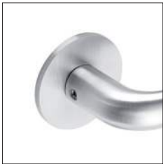
Reduzierte Randhöhe 4 mm