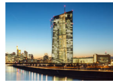
Banque centrale européenne Francfort