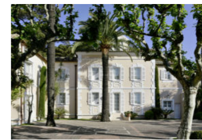
Hotel Cheval Blanc Saint Tropez