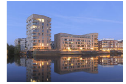
Presqu'île en bois de Rostock Rostock