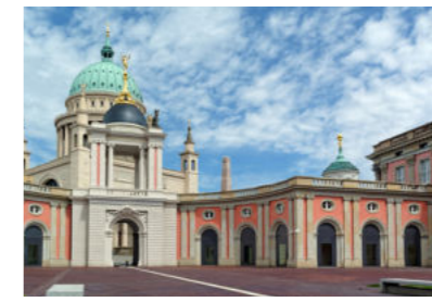
Parlement de Brandenburg Potsdam