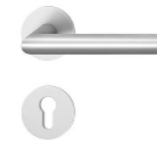
Poignées de porte