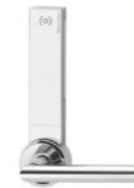
Systèmes de fermeture électronique