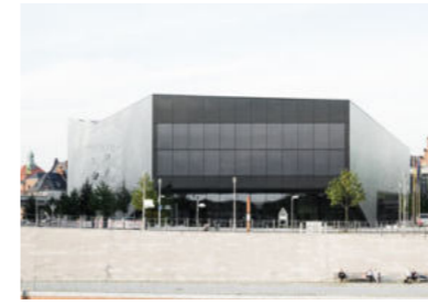
Futurium – Haus der Zukunft Berlin