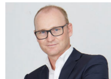
Bastian Scholz ingenhoven architects (Allemagne)

„Il y a de cela presque 30 ans que notre cabinet a fait le pas „de la poignée porte vers la ville“. En principe, l'architecture et le design doivent remplir les mêmes Exigences, en particulier en ce qui concerne l'utilisation, qui permet d'expérimenter et certifier la qualité de la conception d'un bâtiment. Ceci explique surtout pourquoi leurs procédés sont similaires, de la première idée en passant par le développement jusqu'à la représentation physique. Les deux prennent des décisions en fonction de l'utilisateur, des matériaux ou de la technologie disponible, afin d'obtenir le meilleur résultat qualitatif et intemporel. Dans cette optique, HAFI a une valeur ajoutée réelle. Le savoir faire et la grande sensibilité de HAFI pour le design conduisent à une meilleure compréhension et à des solutions optimales, tandis que sa force et sa réactivité remarquable permettent de réagir aux projets les plus exigeants.“