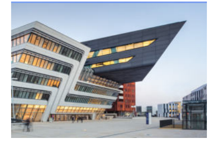
Campus de l'université des affaires Vienne