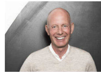
Ben van Berkel Fondateur et architecte principal de UNStudio (Hollande)

„Les produits que nous développons et produisons en collaboration avec HAFI représentent le premier contact des personnes avec l'architecture que nous avons conçue. Ils servent d'intermédiaire entre la personne et le bâtiment. HAFI a une compréhension de cela et produit des designs claires, contemporains et durables avec ce petit quelque chose en plus. Les designs reflètent la qualité de nos Bâtiments, dans lesquels le Design et la fonctionnalité vont de pair.“