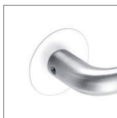
RAL-Farbtönen nach Wunsch