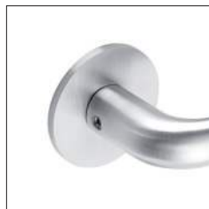
Reduzierte Randhöhe 4 mm