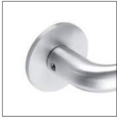
Reduzierte Randhöhe 4 mm